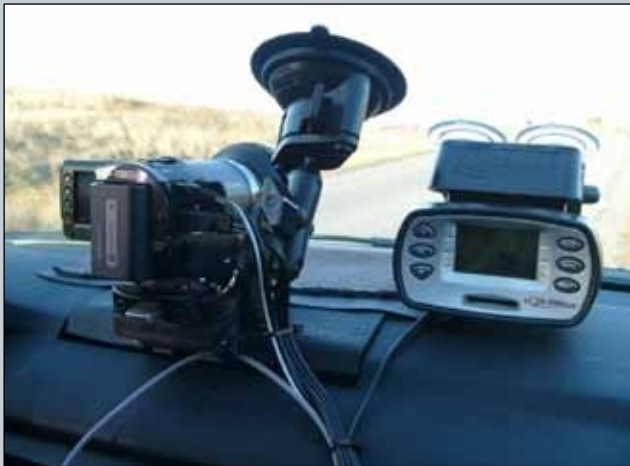
Myndbandsupptökuvél sem var notuð til að taka upp myndir af vegum.

Í tengslum við svo kalla EuroRap verkefni hafa verið tekin upp myndbönd af vegakerfinu. Verkefnið miðaði að því að finna hentugt verkferli við að setja inn stöðvasetningu á myndbandsupptökurnar og þannig auka notagildi þeirra við að skoða aðstæður á vegakerfinu. Þetta tókst og hægt er að merkja myndböndin með stöðvasetningum með innan við 20 m skekkju. Í verkefninu var einnig gerð tilraun til að vinna með upptökuvél Vegagerðarinnar og reyndist það einnig vel mögulegt.